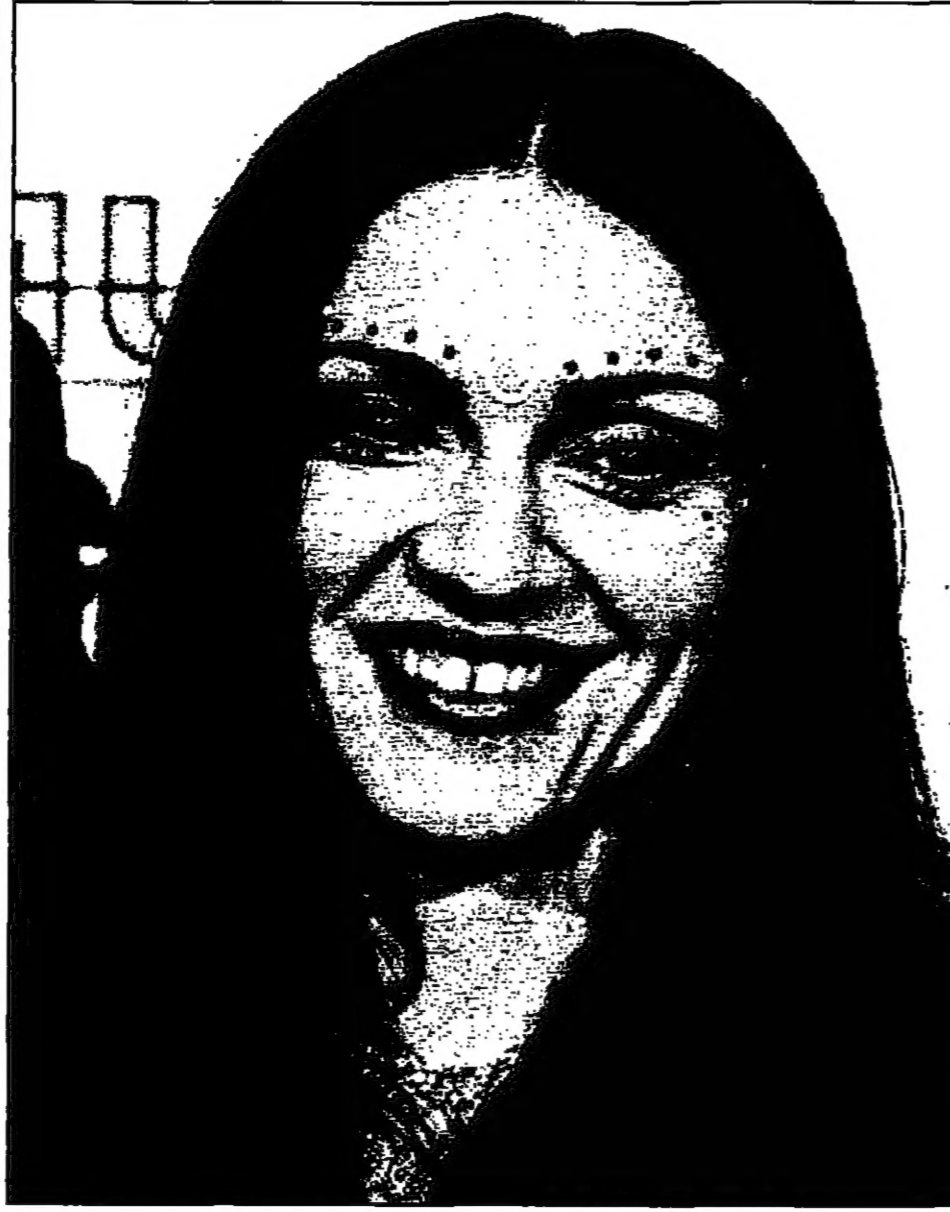
حملت نجمة اماني اليبوب الأمريكية ماوندا ست جوائز في حفل جوائز موسيقى واغاني الفيديو الذي اقيم في اوس انجلوس ليلة الخميس الماضي

بنغلادش - رويترز: هددت الفيضانات منازل اكثر من مليون شخص في بنغا عاصمة بنغلادش التي تكثر من المياه الجوفية. وتهدد الفيضانات بنغلادش التي تكثر من المياه الجوفية.